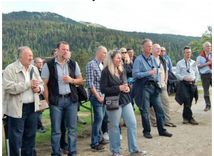
Inauguration de la fromagerie le 14 juin 2013

Les travaux pour la création de la fromagerie ont été réalisés dans les temps ce qui a permis la fabrication de fromage en 2013.