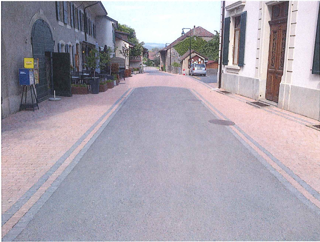
A la route de Genolier