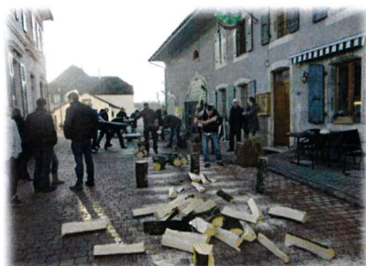
pour finir ainsi sa vie dans l'âtre du Casino.