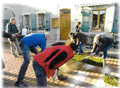
scié dans l'après-midi au « bâtard »,