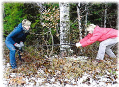
Le 31 décembre au matin : le foyard sera abattu,