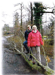
puis emmené triomphalement au village,