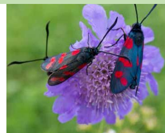
Des zygènes sur une scabieuse

Au printemps... son fourrage est très apprécié. Respectez la prairie, n'entrez pas dans la parcelle