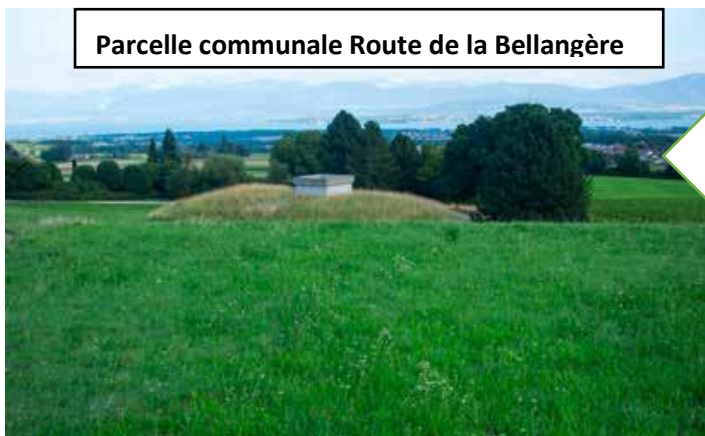
Parcelle communale Route de la Bellangère

En août, la prairie forme un tapis vert (regain)