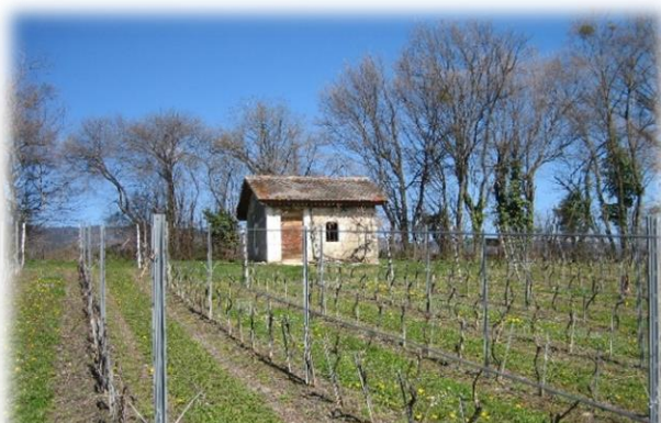
Givrins – En Champ Verret

Il accompagnera idéalement les charcuteries ou de savoureuses viandes rôties.